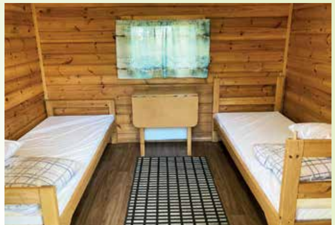
2 hengen mökki