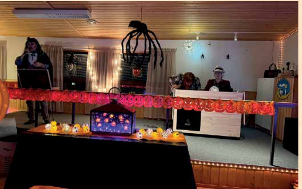
Karaoke laulajia nousi lavalle illan aikana hieno määrä.