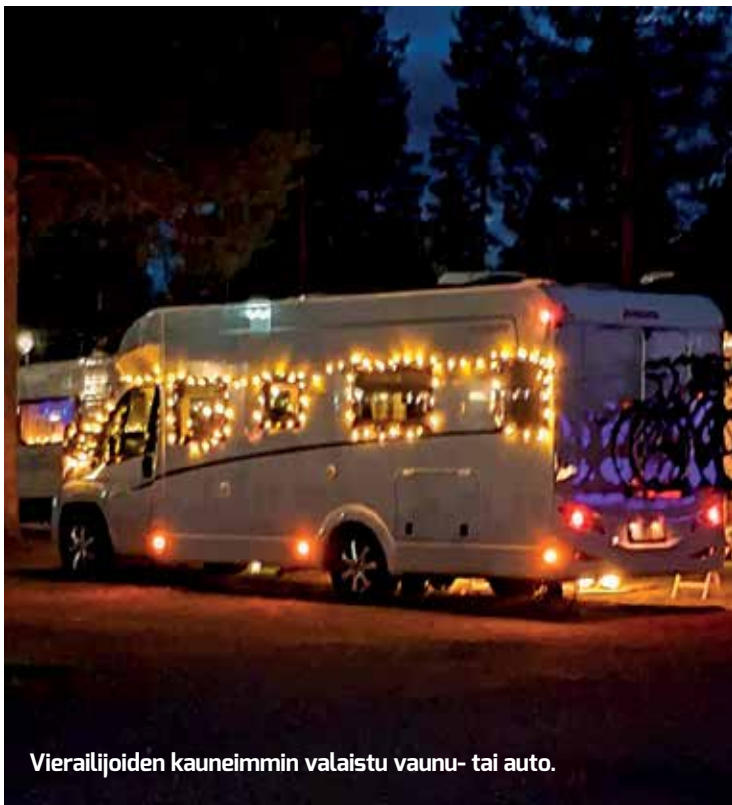
Vierailijoiden kauneimmin valaistu vaunu- tai auto.

Valo on tärkeä symboli Suomessa, koska täällä vuodenajat vaihtelevat voimakkaasti: kesällä on hyvin valoisaa ja talvella hyvin pimeää.