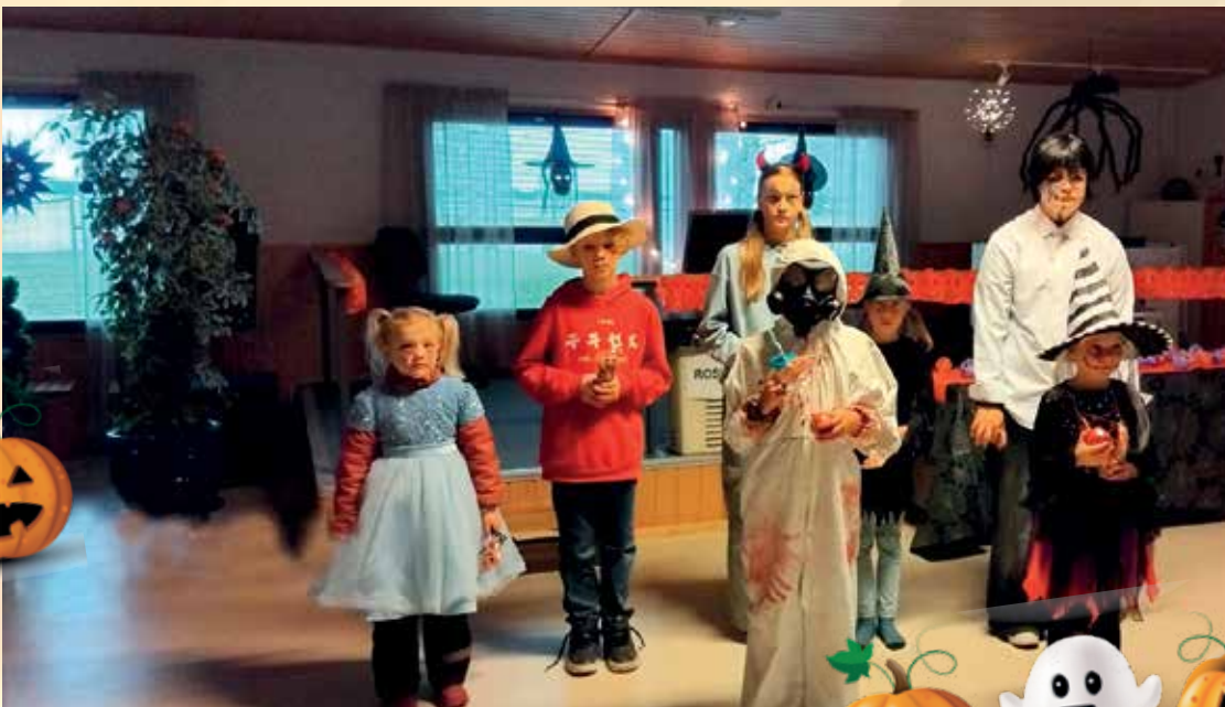
Kauhuasuihin pukeutuneista lapsista valittiin voittajat. He ovat kuvassa etualalla.