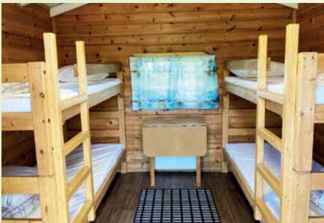
3-4 hengen mökki