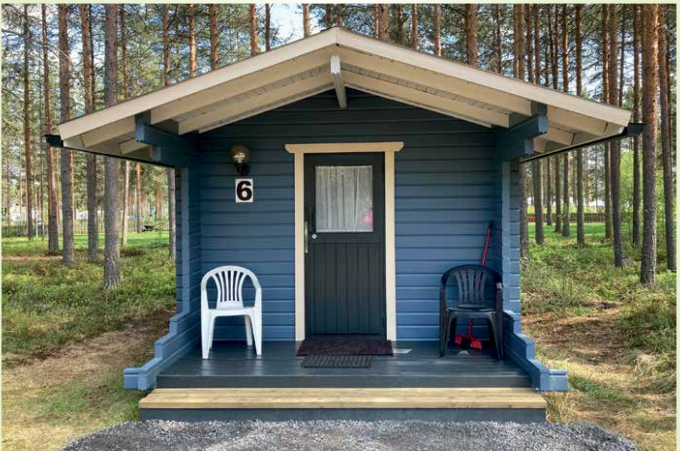
Mökkien väri istuu hyvin ympäröivään luontoon.