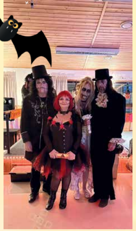
Pelottavimmat asut voittivat.