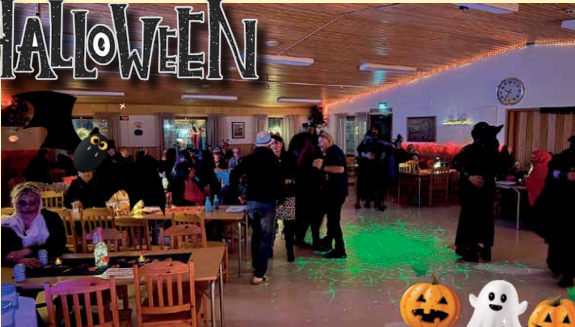
Musiikki sai tanssijat vipattamaan.