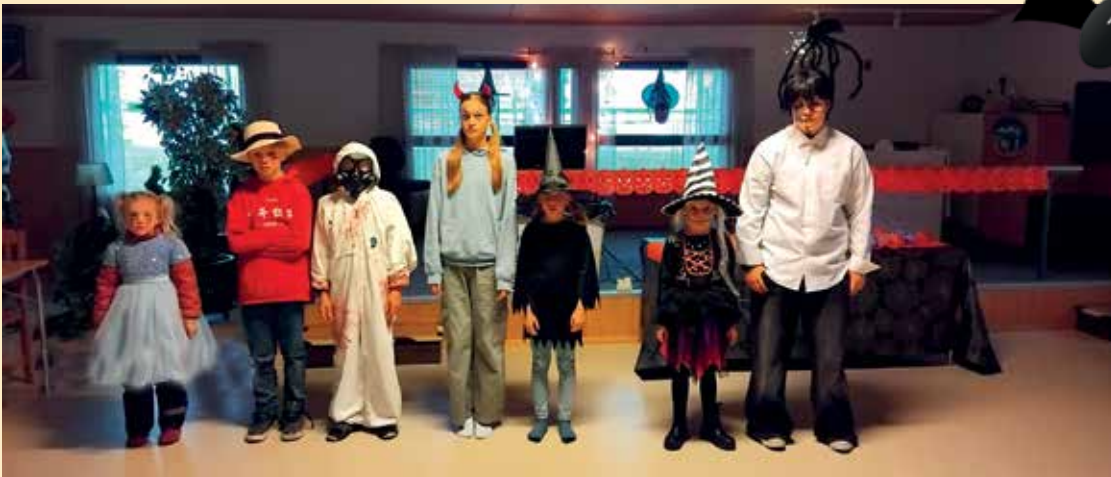
Rohkeimmat tuli yhteiskuvaan hienoine ja karmivine asuineen.