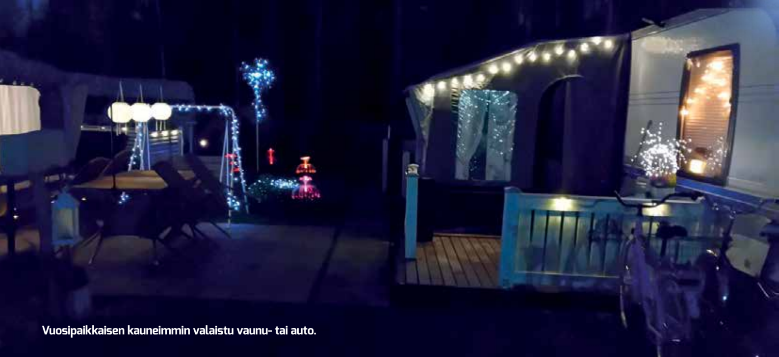
Vuosipaikkaisen kauneimmin valaistu vaunu- tai auto.